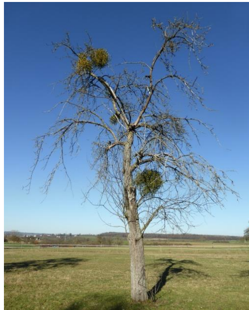
Das Ende: Absterbender Baum