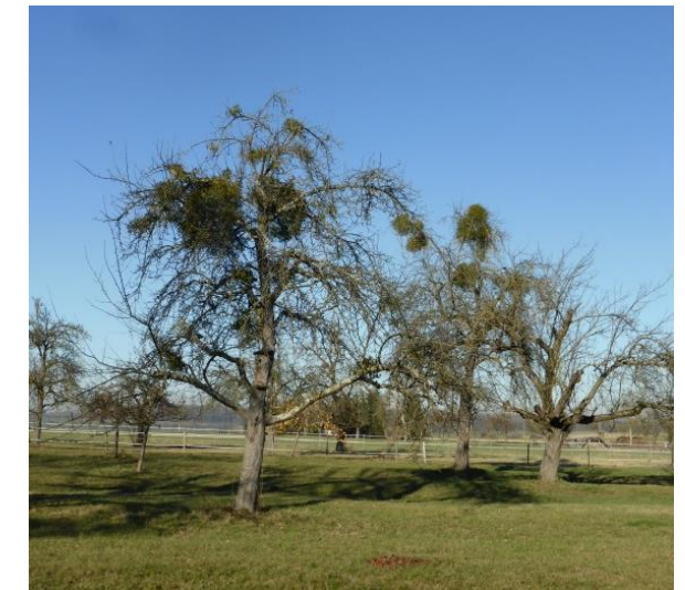
Viele Streuobstwiesen sind überaltert und daher anfälliger für Mistelbefall