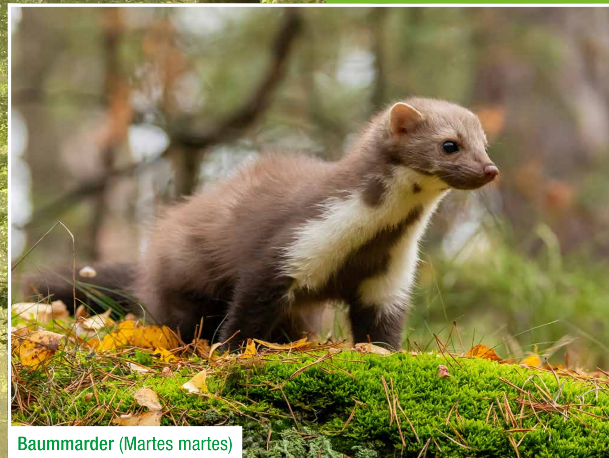
Baummarder ( Martes martes )