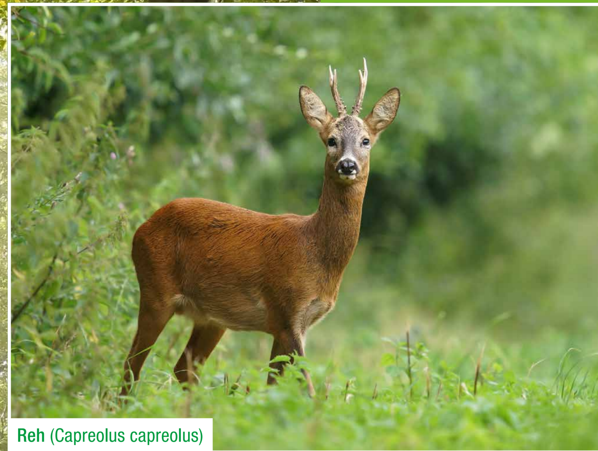
Reh ( Capreolus capreolus )