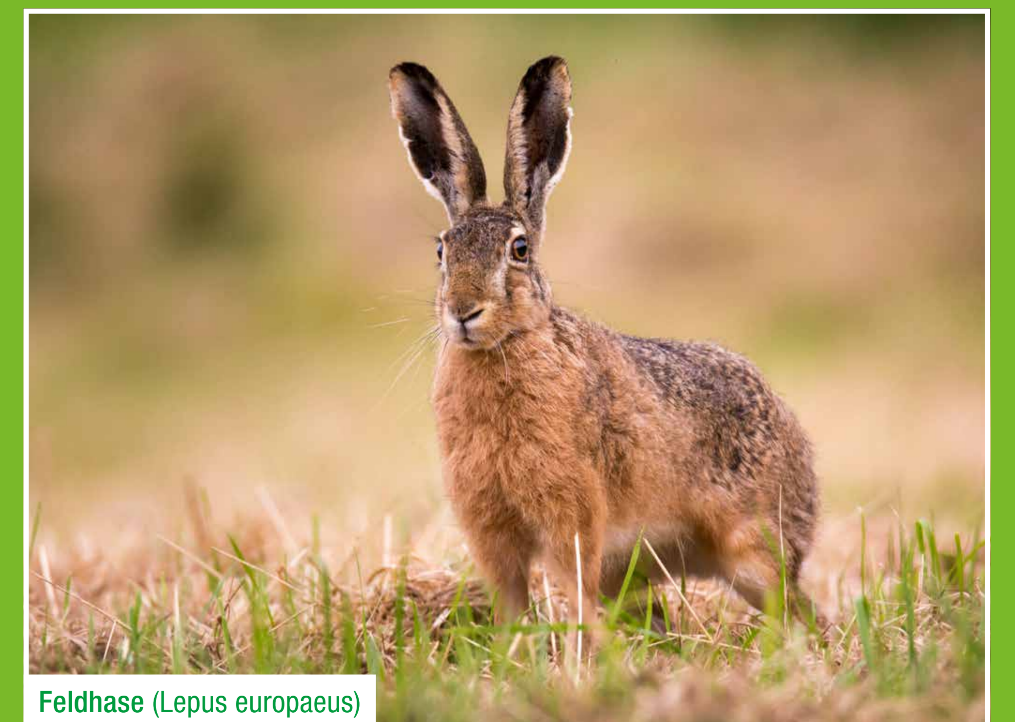
Feldhase ( Lepus europaeus )