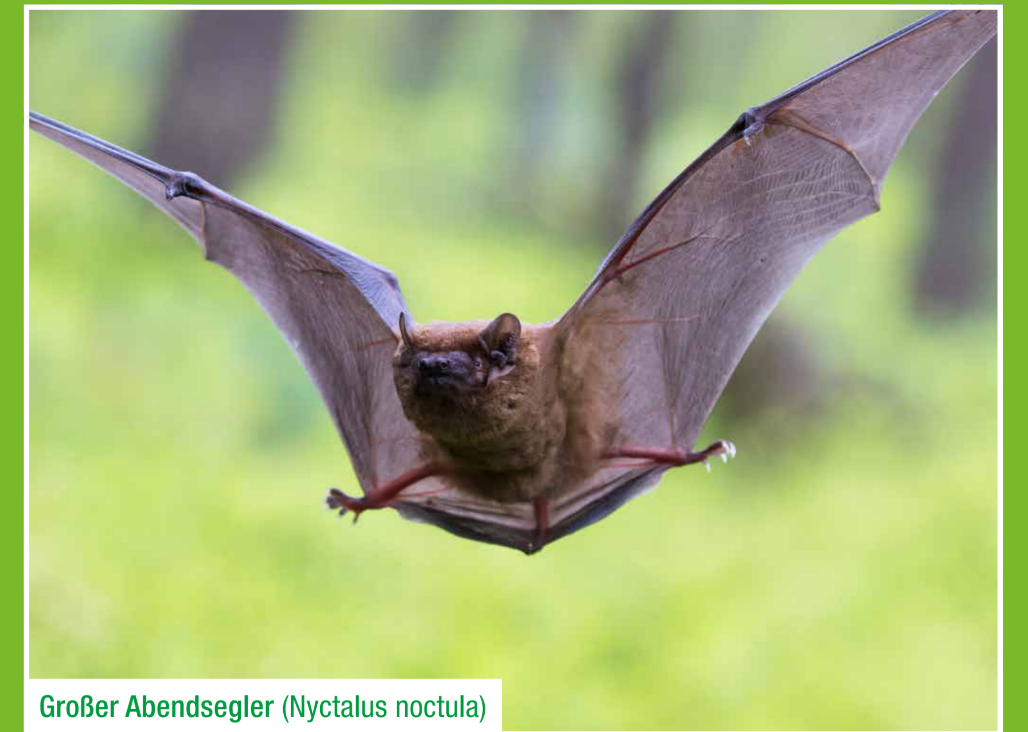
Großer Abendsegler ( Nyctalus noctula )