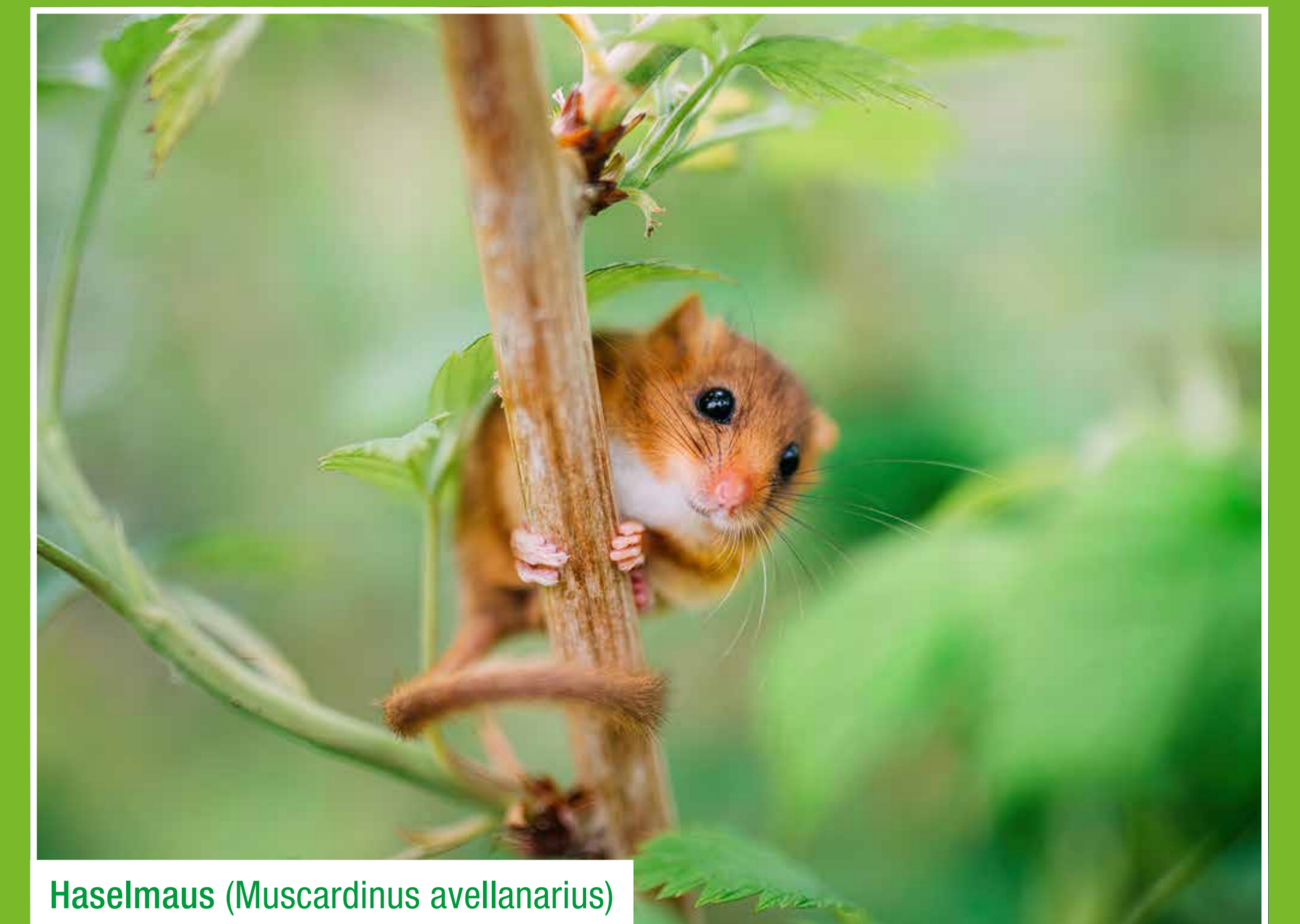
Haselmaus ( Muscardinus avellanarius )