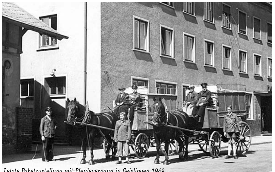
Letzte Paketzustellung mit Pferdegespann in Geislingen 1949

Fotos der Posthalter, der Dienstgebäude und des Dienstbetriebs oder Zeitungsausschnitte. Besonders ausführlich dokumentiert sind die Postämter Geislingen und Göppingen, letzteres als NS-Musterbetrieb im Leistungskampf der Betriebe.